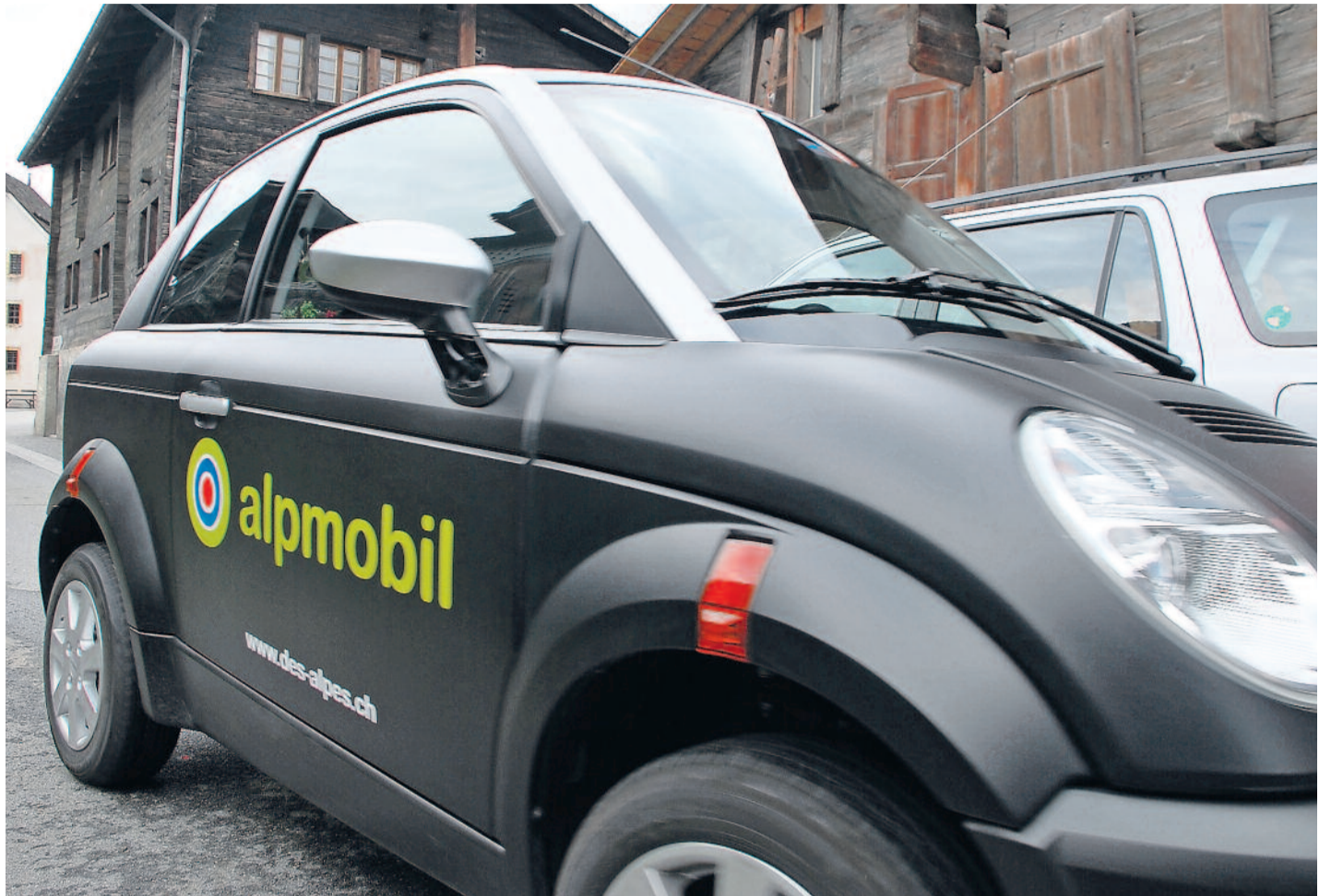
Der Spassfaktor ist hoch: Ein Elektroauto auf dem Weg von Ernen ins Binntal.