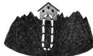
System: WÄRMEPUMPE MIT ERDSONDE